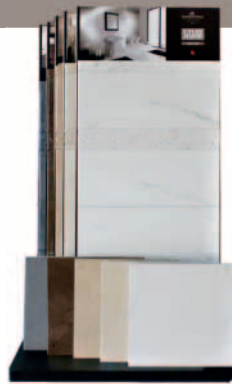
280 KIMART Kit I Tuoi Marmi cm 52 x p. 80 x h 120 (cartelle cm 52x120 + pavimenti sfusi)