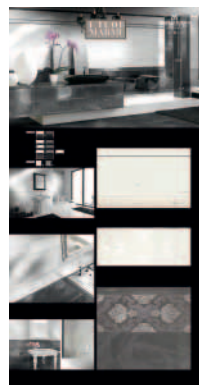
305 ZPAMAF Pannello sinottico cm100x200