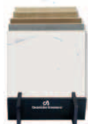
94 KIMARP Culla I Tuoi Marmi pavimenti cm 40 x p. 63 x h 45