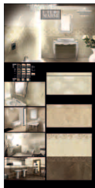
305 ZPAMAC Pannello sinottico cm100x200